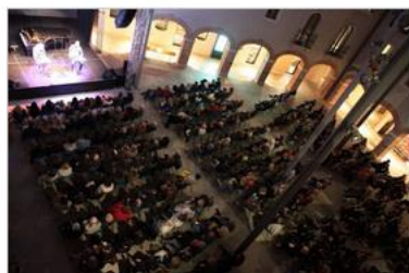
Festival delle Idee 2019_ Chiostrò M9

Alcuni eventi sono già sold-out (anche per ciò che riguarda le liste d'attesa), per altri rimangono ancora posti disponibili. Gli incontri si terranno sparsi per le tante sedi della città di Mestre e di Venezia .