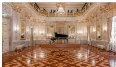
Teatro La Fenice di Venezia: le Sale Apollinee