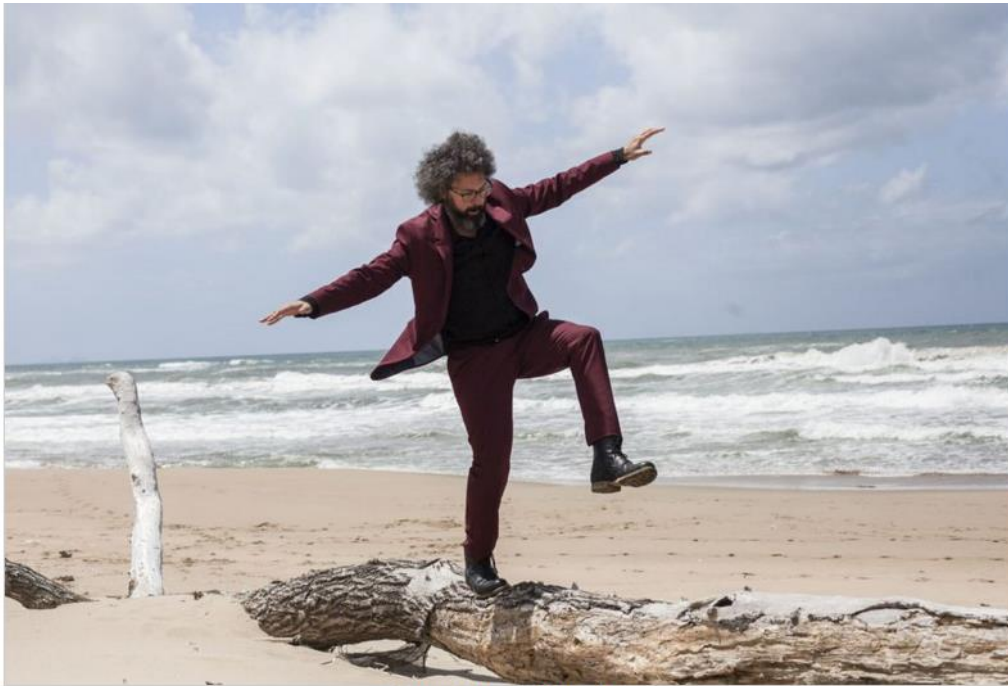
Simone Cristicchi

Nei giorni successivi non mancano ulteriori suggestioni: gli interventi di Galimberti (in data 20 ottobre sono presenti due appuntamenti) dal titolo 'Il mito della crescita' e 'L'uomo nell'età della tecnica' aprono al profilo filosofico e sociologico dell'uomo moderno.