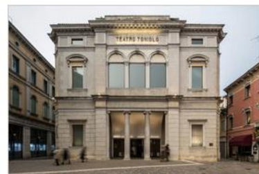
Il Teatro Toniolo a Mestre