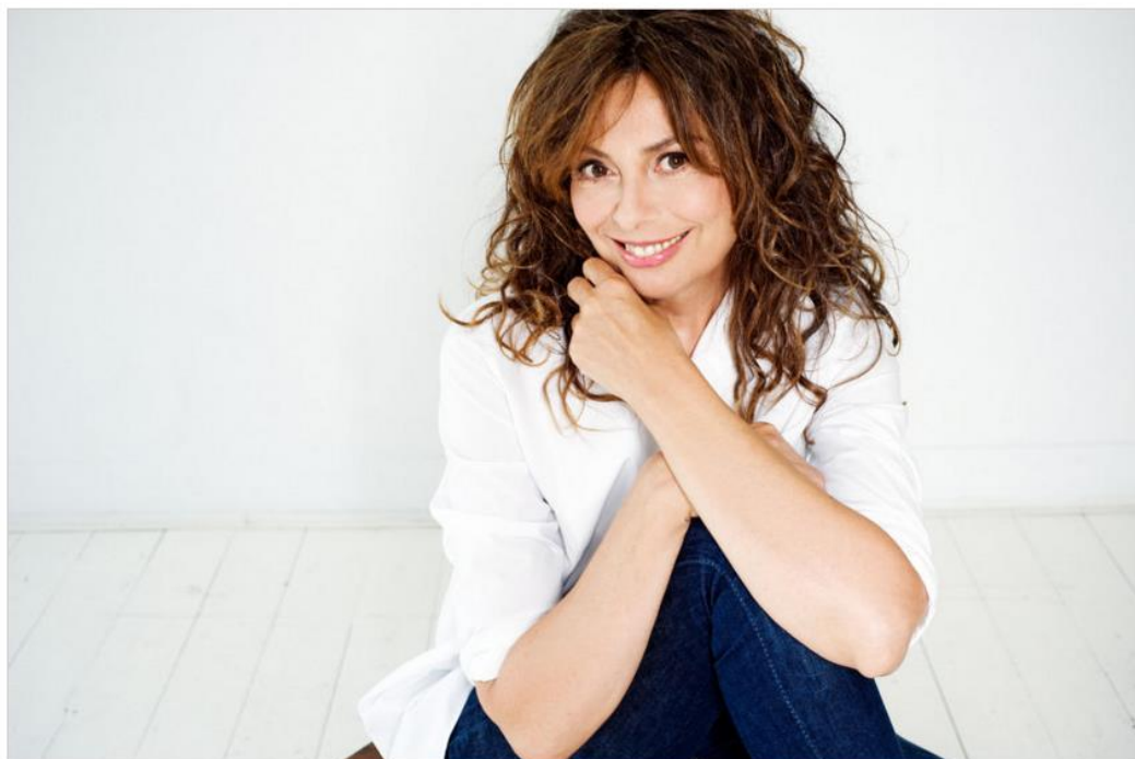
La cantante Alice

Chiude, il 22 e 23 ottobre al Teatro Malibran di Venezia, la cantante Alice , nel ricordo della poesia in musica di Franco Battiato. L'evento, già sold-out alla sua presentazione, è stato replicato in due giorni per consentire un maggiore afflusso. Non solo, sarà inoltre possibile iscriversi a delle liste d'attesa dove prenotarsi nel caso in cui la disponibilità dei biglietti sia già terminata.